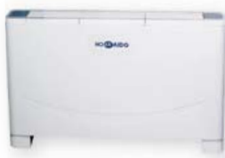
UNITÀ A VISTA EXPOSED TYPE UNIT

Modello compatto ed elegante, con piedini estetici (opzionali).