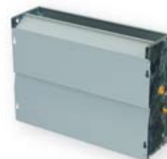
UNITÀ A INCASSO RECESSED TYPE UNIT

Compact and elegant model, with aesthetic feet (optional).