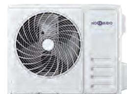
HCNTS 710 ZA