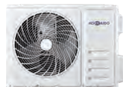
HCNTS 530 ZA