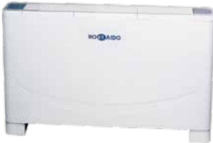
HFLMM 200-900 W-SN