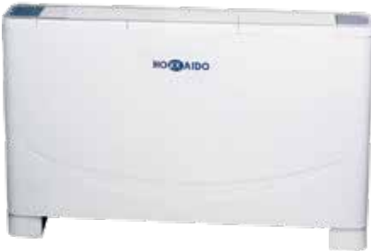
HFLMM 200-900 W-SN