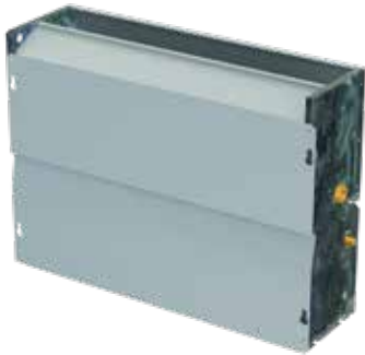
HFYMM 200 W-SN