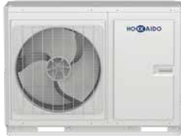
Monophasé 8.20-15.70 kW HCWNGS 801 - 1001 - 1201 - 1401 - 1601 Z Triphasé 10.20-15.70 kW HCWSGS 1001 - 1201 - 1401 - 1601 Z