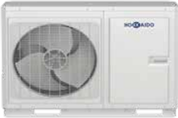
Monophasé 5.00-6.00 kW HCWNGS 401 - 601 Z