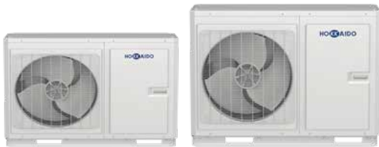
Monophasé 5,00~6,00 kW HCWNGS 401 - 601 Z